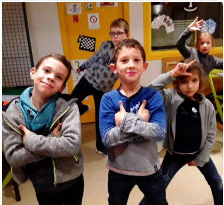
L'équipe de reporters reproduit les attitudes des footballeurs